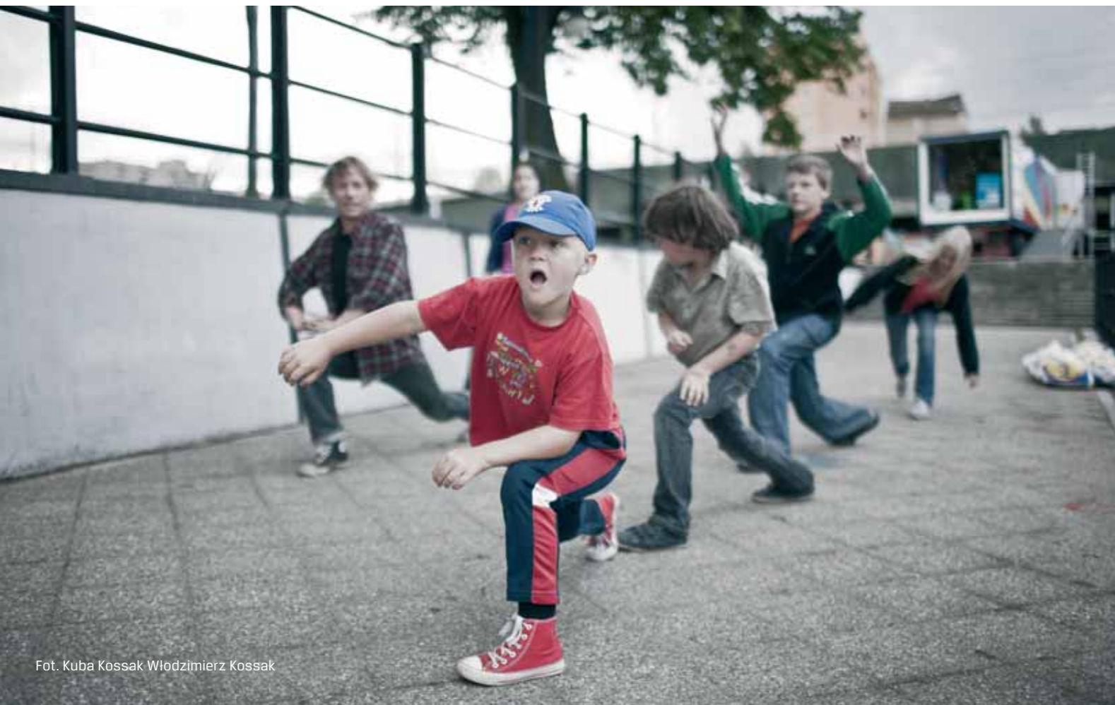
Włodzimierz Kossak