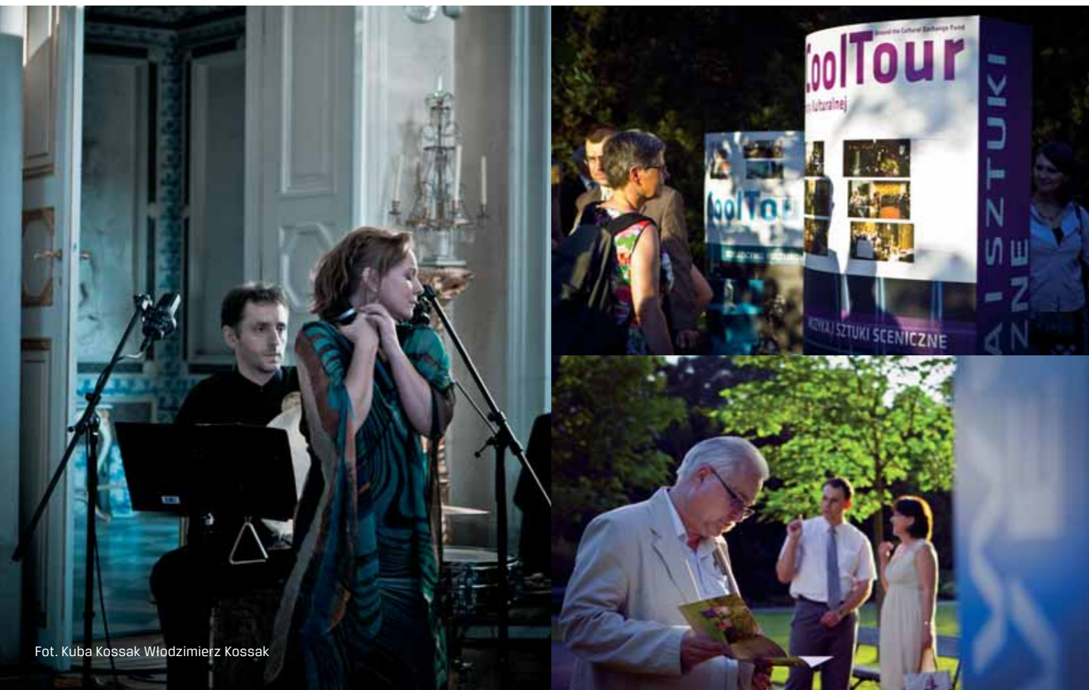
Fot. Kuba Kossak Włodzimierz Kossak

5 czerwca 2011 r. w Pałacu na Wyspie w Łazienkach Królewskich w Warszawie odbyła się uroczysta inauguracja wystawy CoolTour – wokół Funduszu Wymiany Kulturalnej prezentującej 40 wybranych projektów realizowanych w ramach Funduszu.